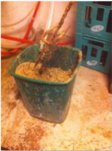
4 år kalk

Kalk taget ud fra varmtvandsbeholder som har kørt i 4 år uden eftersyn: