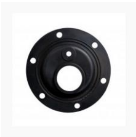
Bundpakning - Tesy vandvarmere

Vi anbefaler at gummibundpakningen skiftes hver gang man har eftersyn på varmtvandsbeholderen.