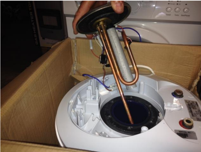
Sådan se der ud inde i en TESY bereder